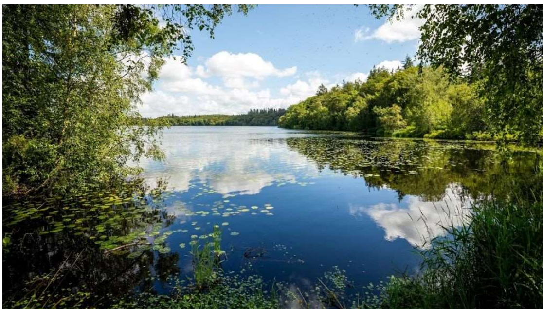
St. Økssø – Rold Skov.

Som et alternativ til kommunikationen ved aflevering og afhentning, kommunikerer vi (fortrinsvis kollektivt) via "AULA". Vi bruger den skriftlige kommunikation til at dokumentere de tiltag og den læring, vi oplever børnene får del i. Vi giver forældrene indblik i vores aktiviteter via fotos, dokumentation og nyhedsbreve.